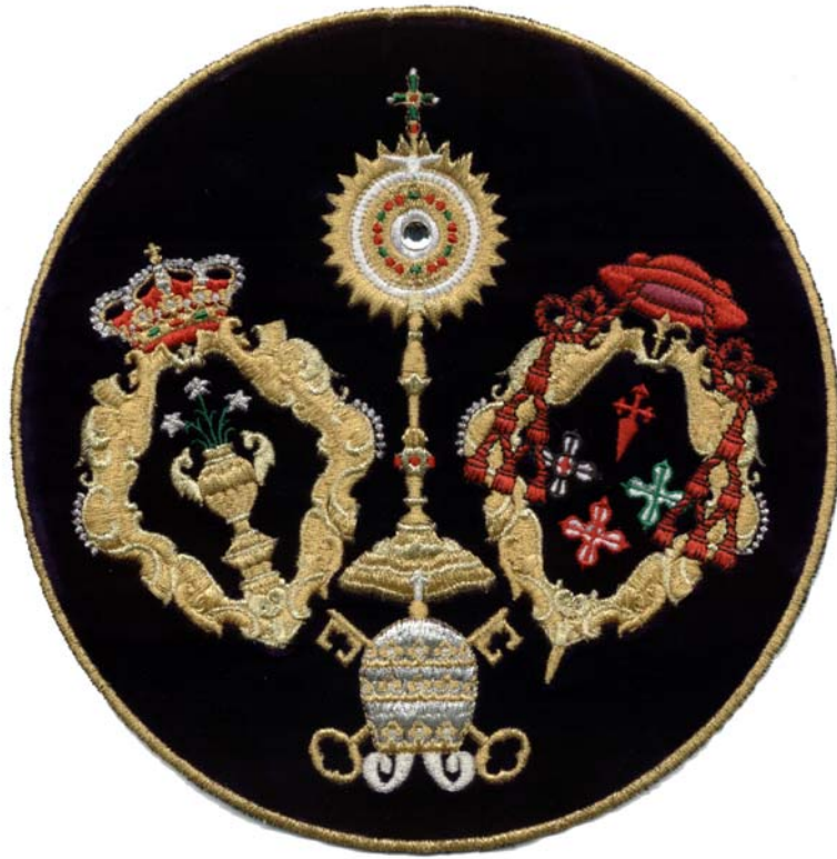
Escudo de Capa